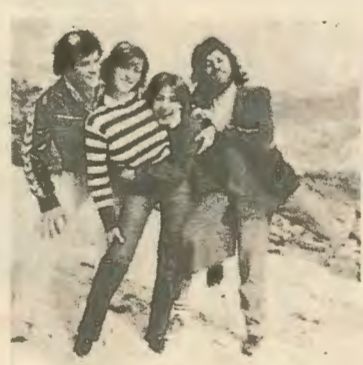
4. Κάπου στα βουνά του Πενταδάκτυλου. Ξέφρενο πανηγύρι από νεολαίους για την απελευθέρωση της πατρίδας από τον ζυγο.