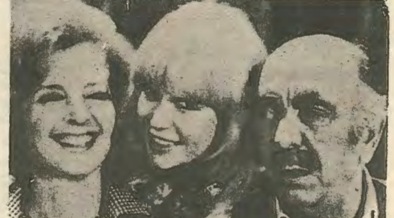
7. Αθηναίοι επίσημοι ενώ πληροφουρούνται από την Τ.Υ το μεγάλο γεγονός. Περίεργα ερωτήματα δημιούργησε η έκφραση του αντρος δεξιά που μ' αυτή σαν ν' αμφισβητεί τη σπουδαιότητα του γεγονότος...

Ήταν πραγματικά συγκλονιστικά τα γεγονότα του τελευταίου δεκαπενθημέρου. Μισός αιώνας αγώνων βρήκε τη δικαίωση του στις 4 τ' Απρίλη του 81. Με μια σαρωτική επελαση οι «δυναμεις της αλλαγής» συνετριψαν τον εχθρο φτάνοντας στη Νίκη κι' Απελευθέρωση της Κύπρου. Γι' αυτή τη περήφανη Νίκη αφιερωνώ σήμερα ένα φωτογραφικό ρεπορταζ με τα κυριώτερα γεγονότα κατά και μετά την μεγάλη Νίκη.