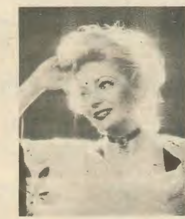
6. Η γνωστή αυτή προσωπικότης μόλις πληροφορήθηκε τα γεγονότα της 4ης Απριλίου διέκοψε την πρενς-κονφερانس που είχε με τους δημοσιογράφους στο πρόγραμμα «το αστέρι των τετραγώνων». Σ' αυτή τη στάση ασαφείας για την ευτυχία της μικρης Κύπρου την συνέλαβε ο φακός.