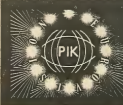
3. Η Κυπριακή σημαία θ' αντικατασταθεί από την πιο πάνω. Είναι μια πράξη ευγνωμοσύνης για το Εθνικό Ιδρυμα και τη βοήθεια που παρέσχε στον αγώνα.