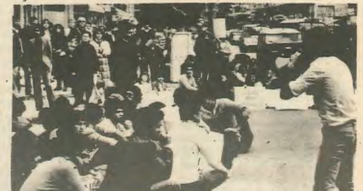
8. Ο λαός και ειδικά η νεολαία ξεχύθηκε στους δρόμους για να πανηγυρίσει την μεγάλη απελευθέρωση. Πάνω φοιτητές του ΑΤΙ ενώ τραγουδούν πατριωτικά τραγούδια σε καθιστική γιορταστική εκδήλωση στην Πλατεία Ελευθερίας.