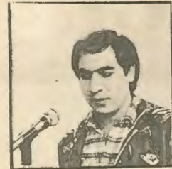
2. Ο θεωρητικός της μεγάλης πράξης. Στη φωτογραφία ενώ απευθύνεται στο Κυπριακό λαό κάθε Κυριακή από το ραδιόφωνο μετά τη Θεία Λειτουργία. Η Νίκη ήταν πάντα στο σοβό μυαλό του.