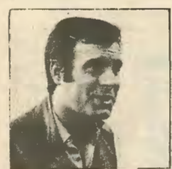
1. Ο κύριος συντονιστής της νύκτας της μεγάλης Απολύτρωσης. Η Κυπριακή Δημοκρατία στη τελετή του Δουβλίνου εκφράστηκε υπέροχα από τον Εθνικό Ηρωα.