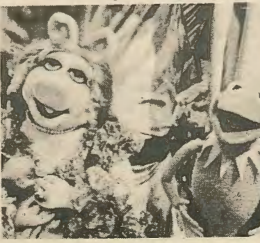
6 1/2. Μόλις μάθεύτηκε το γεγονός σ' ένα γύρισμα των Μάππετ Σώου.