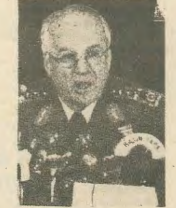
5. Ο στρατηγός Εβρεν τάχει χαμένα. «Δεν μπορώ να συνέλθω από την ήττα», δήλωσε από τον ραδιοφωνικό σταθμό της Αγκυρας. Το ερώτημα πάντως ακόμα παραμένει. Πόσο ακόμα θ' αντέξει αυτή τη πίεση μας η Τουρκική Χούντα;